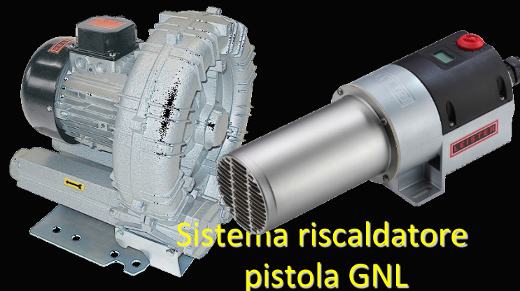
Sistema riscaldatore pistola GNL