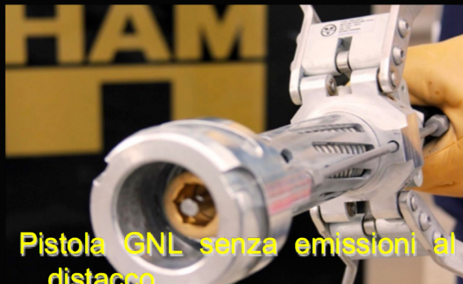
Pistola GNL senza emissioni al distacco