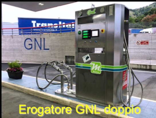
Erogatore GNL doppio

Il centro ricerche Ham ci permette di essere sempre all'avanguardia con prodotti sempre innovativi, come: