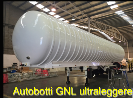
Autobotti GNL ultraleggeri